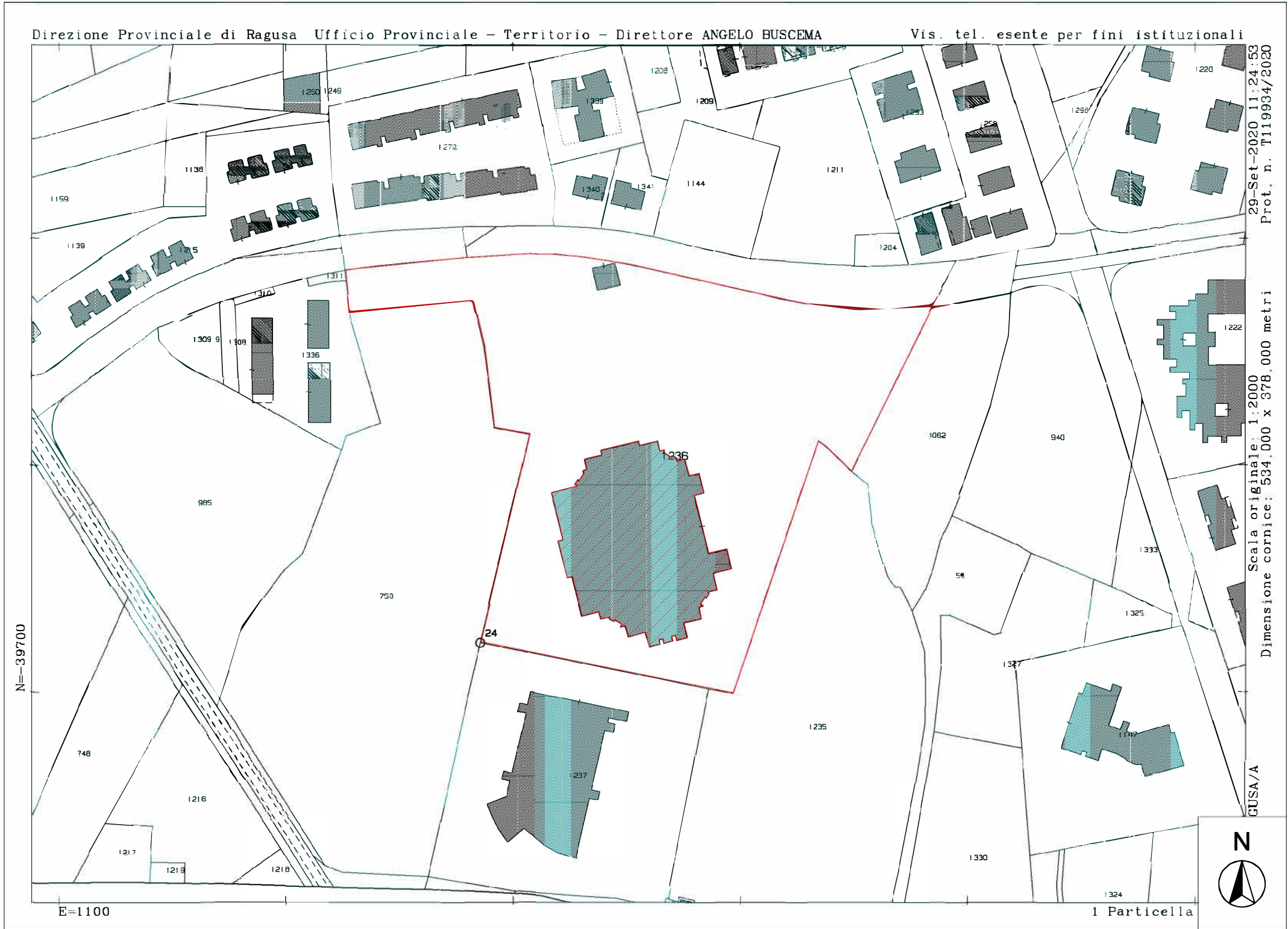
Stralcio di mappa catastale Foglio N° 66 del comune di Ragusa