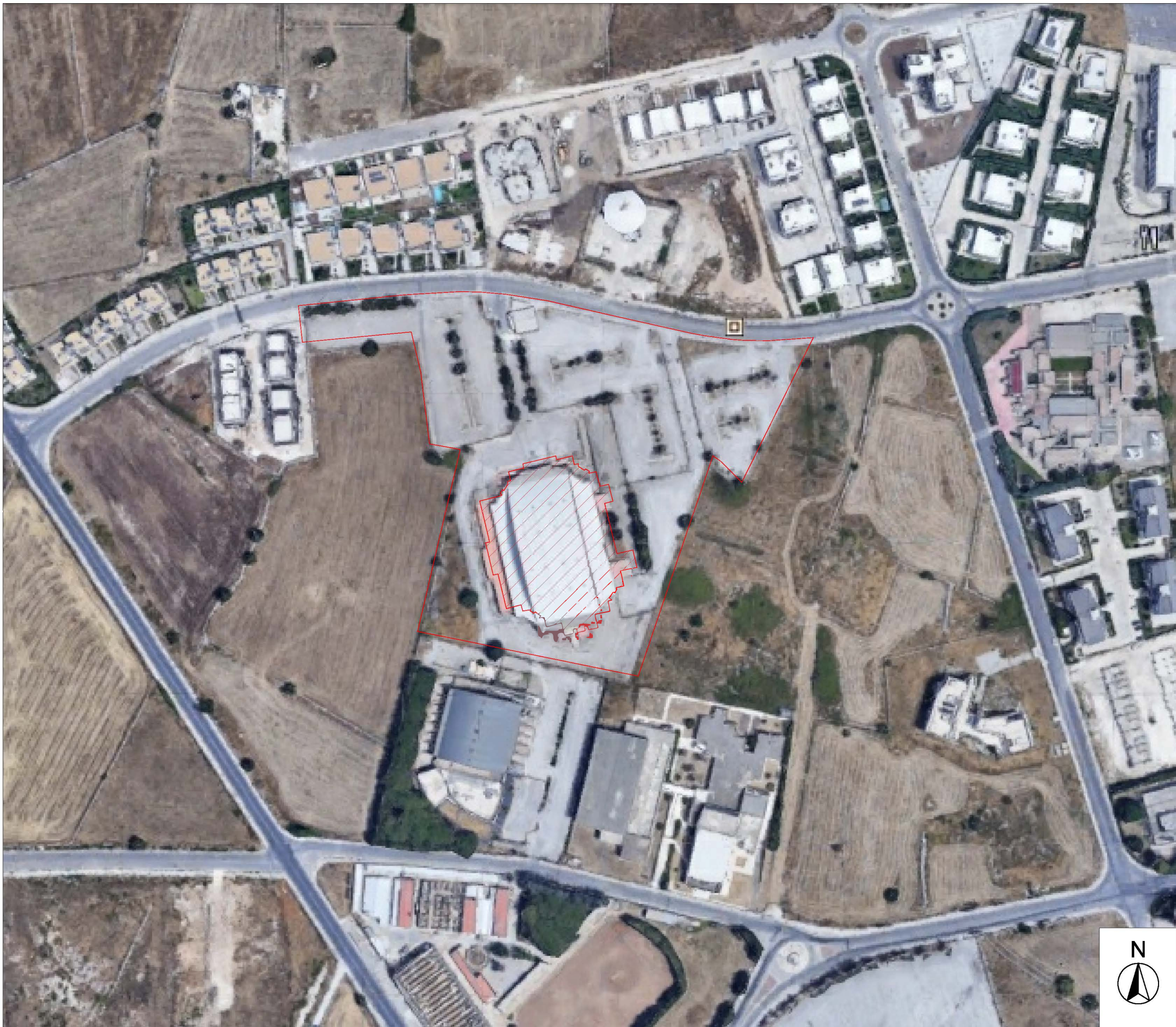
Foto Satellitare Lat. 36.909292°N- Long. 14.708639°E